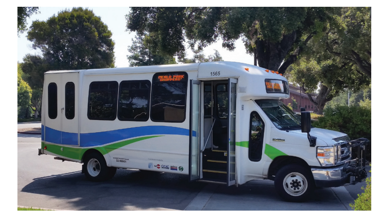
Los autobuses de Menlo Park son de color blanco, con rayas azules y verdes por el lado del vehículo, y "Commuter.org" por el detrás.

Menlo Park shuttle vehicles are white, with blue and green stripes along the side and "Commuter.org" on the back.